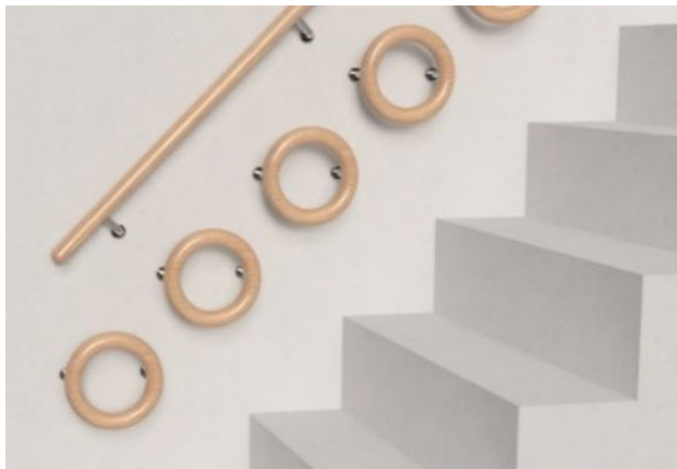
第1回 最優秀賞作品

当社では手すりの取付、段差解消、ドアを引き戸に交換するなどの介護リフォーム事業を展開しており、特にニーズの高い手すりは自社製品開発も手掛けています。しかし「介護知識や施工の技術力はあるが、意匠力はない・・・」という課題があったため、昨年、高齢化社会の暮らしを豊かにするデザインアイデアを発想豊かな学生やデザイナーたちに向けて募集するデザインアワードを初開催。北海道から沖縄まで16歳～52歳の幅広い年齢層から18名のエントリーがあり、様々なデザインアイデアが提案されました。