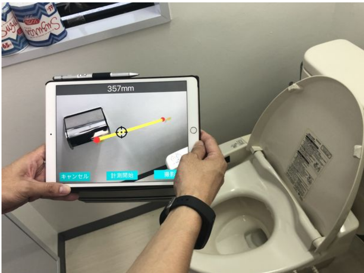
見積アプリ『FUSII』による手すりの設置

これまで介護事業は社会貢献の側面への注目は高いものの、ビジネス化することは難しいとされてきました。そこで当社では、“きちんと収益を上げる”ことを重視。同時に、介護リフォームで重要な“高齢者の自宅での危険を1日も早く取り除く”ことを目指し、サービスを日本全国に広げるためのフランチャイズ展開、収益化するためのビジネスモデル特許取得、そして現場の働き方改革に貢献するAIアプリの開発など革新的な挑戦を行っています。