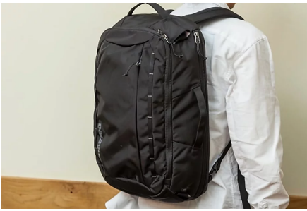
パタゴニアのオフィスで働く社員に人気NO.1 新生活にオススメ... マストリスト