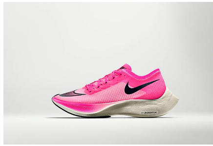
トップランナーがこぞって着用 ピンクの厚底シューズ「ヴェイ... 今日からランナー