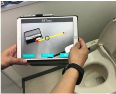
左: 自社開発の見積AIアプリ