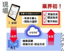
上: 自社開発の見積AIアプリを使った場合 下: クラウド上の管理システム