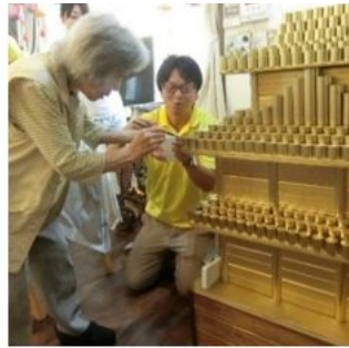
右: 天守閣プロジェクト