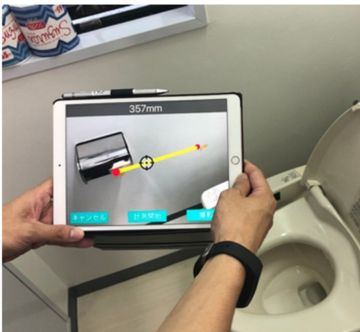
見積アプリ『FUSII』による手すりの設置

また加盟するフランチャイズオーナーは、他に仕事を持つ副業が9割で、未経験や異業種からの参入の割合も高く、取り組みやすさも特長のひとつです。