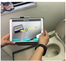
見積アプリ『FUS II』による手すりの設置