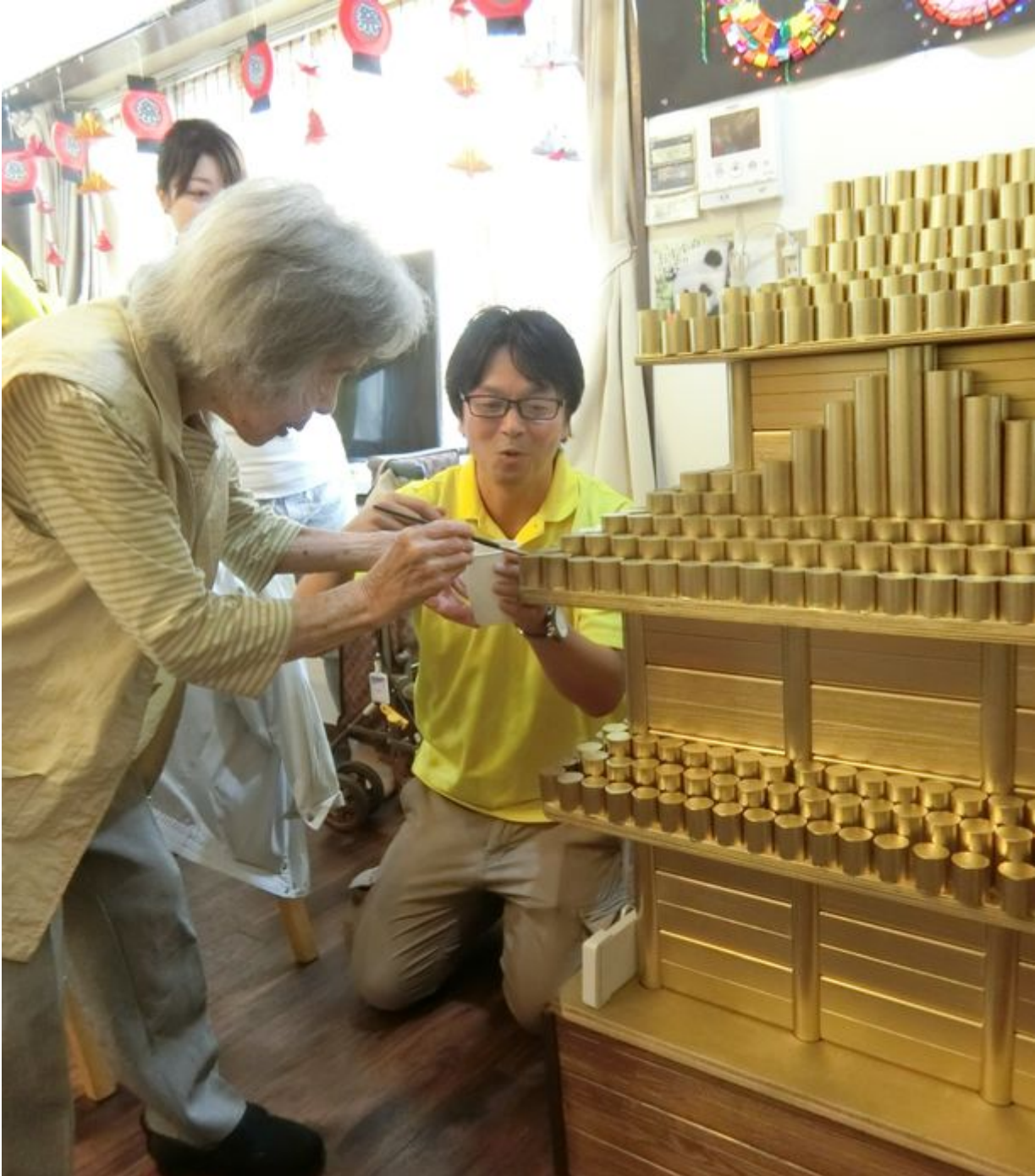
代表でひと塗りする94歳の利用者

今回、ニューワズ株式会社(本社：滋賀県大津市、代表取締役：新庄 一範)が運営する施設『真情デイ・サービス』の『きらめき』(住所：東京都江戸川区)、『西小岩』(住所：東京都江戸川区)、『細田』(住所：東京都葛飾区)に寄贈しました。城のシンボルとしての役目を担う天守閣は、手すりとして使用できなかった余った端材を使用して、全体を金色に仕上げました。ゴールドには金運に効果があり、身に着けると富や名誉や権力、幸福をもたらすと言われ、優れた浄化力を持ち、様々な病気の治療薬としても用いられています。